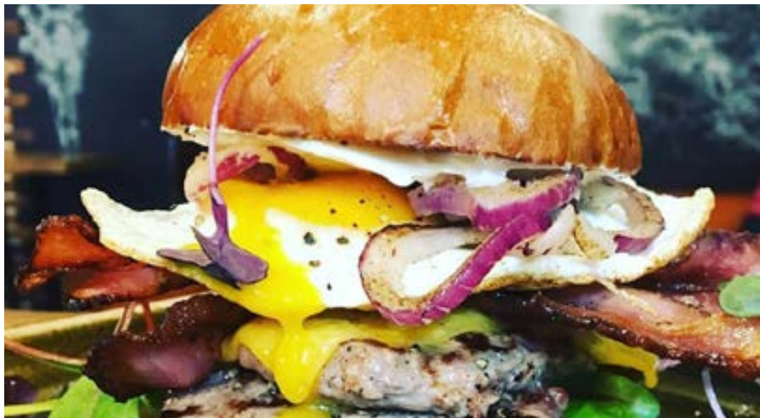
Estonian Burger Factory burger