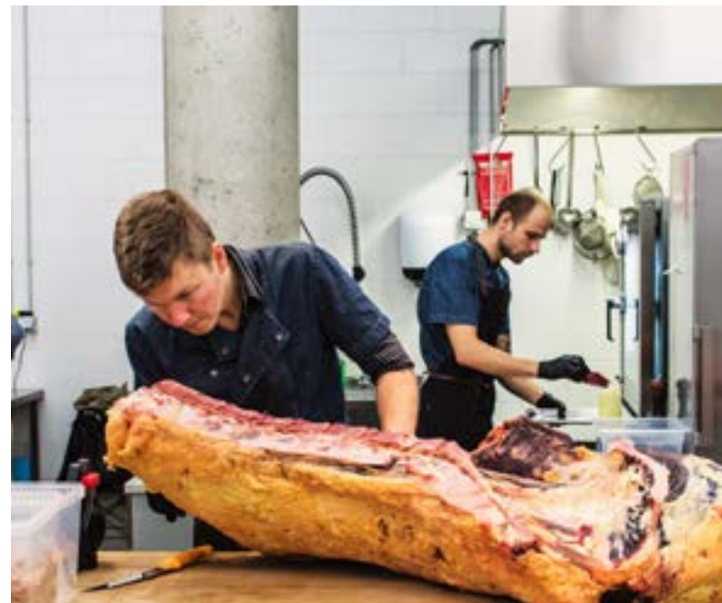
Lihuniku Äris looma lõikamine