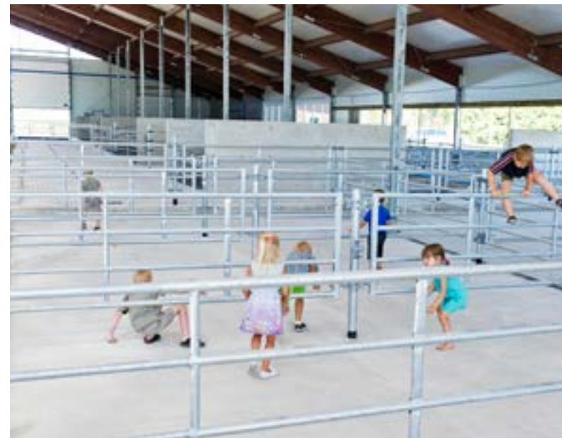
Kokku 300 looma mahutavasse lauta tuuakse lehmad peagi sisse, seni on Pikkmeetsade pere lastel siin tore turnida.