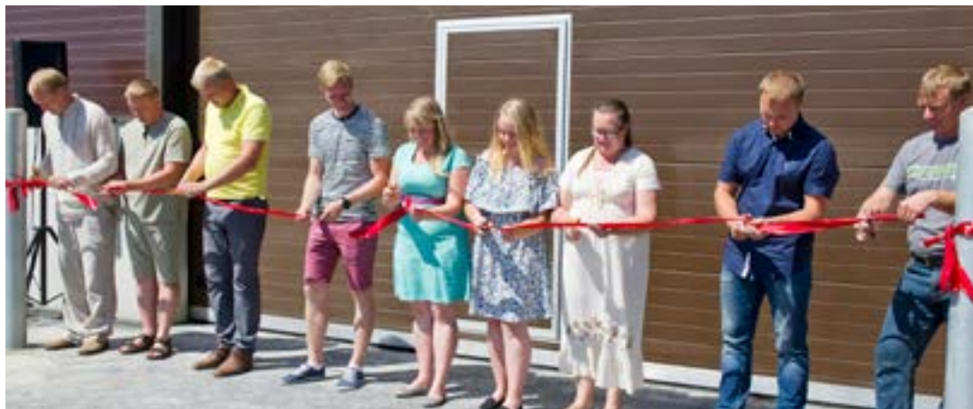
Pikkmeetsade pere lõikab linte koos ehitajatega Nordecon Betonist.

Lauda investeeringule lisaks tuli vahetada silo- ja sõnnikukäitlemise tehnoloogiat. Nüüd asume lehma uue süsteemiga harjutama, samuti soovime lüpsikarja oluliselt suurendada – laut on ehitatud ju praegusest ligi kaks korda suurema arvu lehmade jaoks. Tulevikus on laudakompleksi juurde kavas ehitada ka meierei.