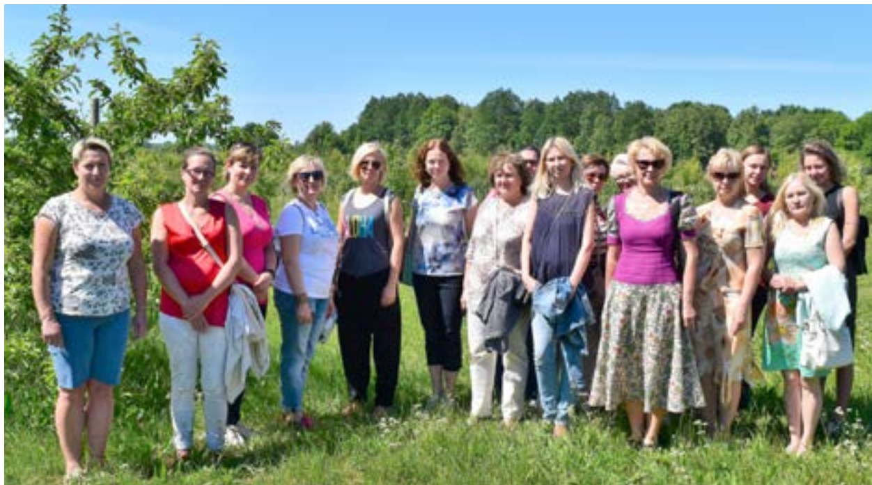
Tallinna lasteaedade esindajad Niliske talus.

tada toitlustamise ökomärgist ja kuidas on õige viidata mahetoorainele.