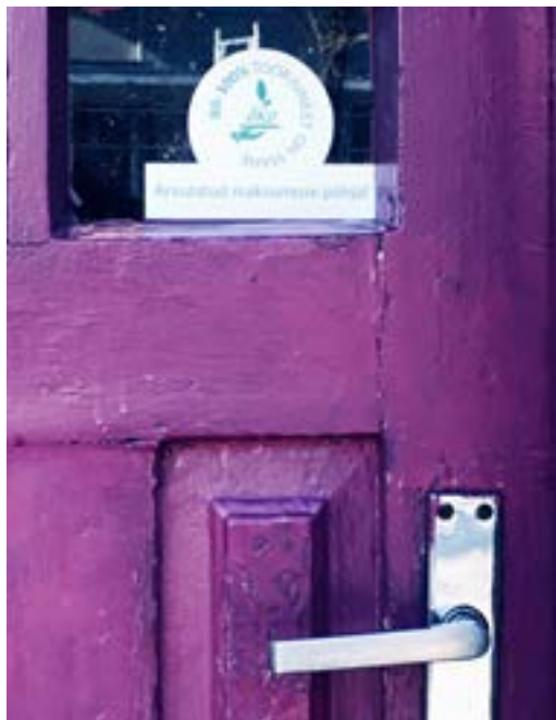
Karlova kohviku uks

„Selle märgi puhul on hea, et saab valida kolme vahemiku vahel: kui päris 80–100% ei jaksa või saa, siis on alati võimalik alustada väiksemast protsendist. See on suurepärane võimalus ennast proovile panna, sest kindlasti peab tooraine nimel rohkem pingutama, kuid meie arvame, et ka tulemus on oluliselt parem.“