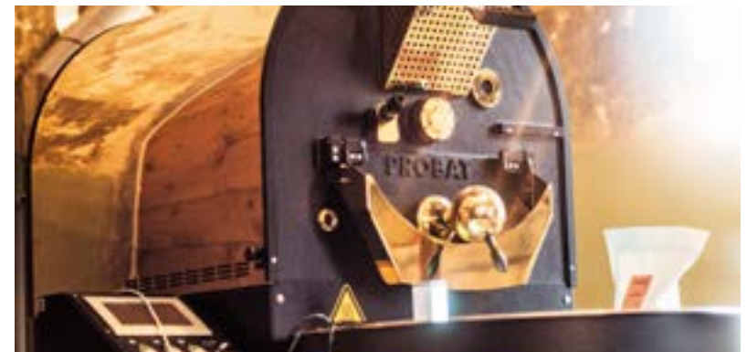
Karlova kohviku röster