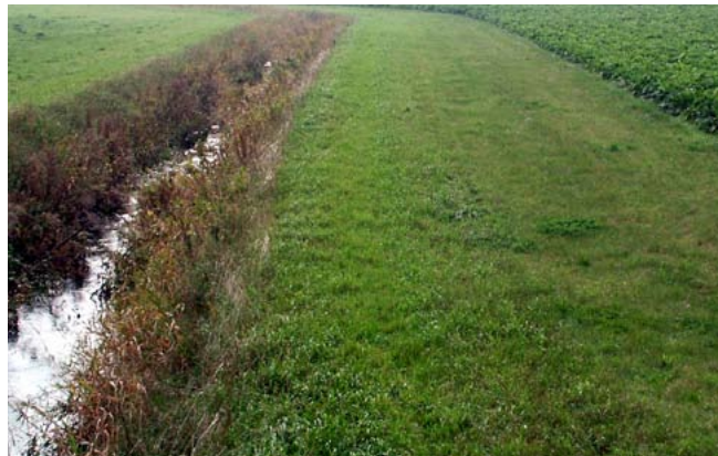
Niidetud puhverriba pole kohustuslik, vaid üks võimalusi.

Väetiseks loetakse ka kõik orgaanilised väetised, sh sõnnik. Maaparandussüsteemi eesvool on liigvee ärajuhtimiseks või vee juurdevooluks rajatud veejuhe või loodusliku veekogu reguleeritud lõik, millest sõltub reguleeriva võrgu nõuetekohane toimimine (Maaparandusseaduse § 3 lõige 7). Tavaline veepiir on Maa-ameti põhikaardil märgitud veekogu piir.