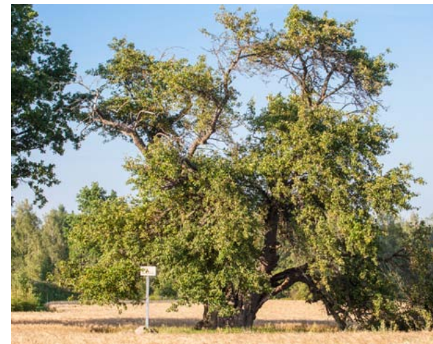
Oti metsõunapuu Viljandimaal.

Analoogne nõue on HPK nõudena kehtinud alates 2010. aastast, täpsustatud on konkreetsed looduse üksikobjektid, mis võivad põllumajandusmaal esineda.