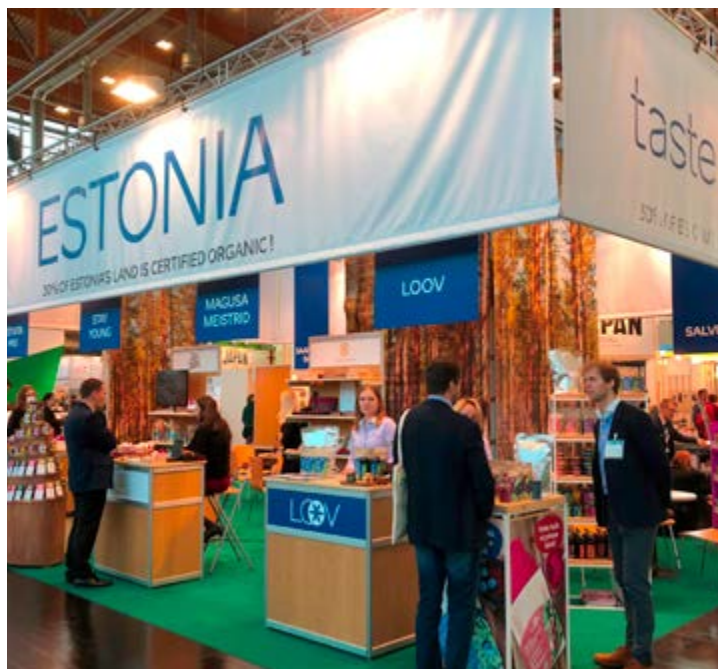
Eesti mahetootjad Biofachi messil

Lisaks Biofachile on ka mitmeid teisi messe, kus meie maheettevõtted viimastel aastatel osalenud on. Paljud on käinud nt Malmös toimival messil Nordic Organic Food Fair või Helsingis toimival messil Veganmessut. Küsisime moodsate külmpressi- ja survetöötlusseadmetega (HPP-seadmed) mahemahlu valmistava Heyday Organic OÜ juhilt Janno Veskimäelt arvamust messidel osalemise olulisuse kohta.