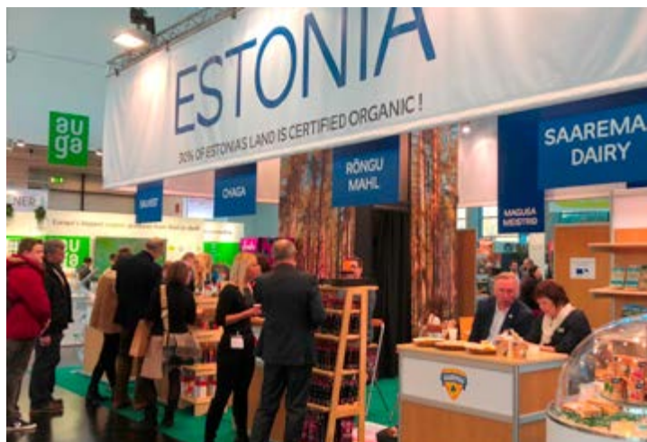
Eesti mahetootjad Biofachi messil