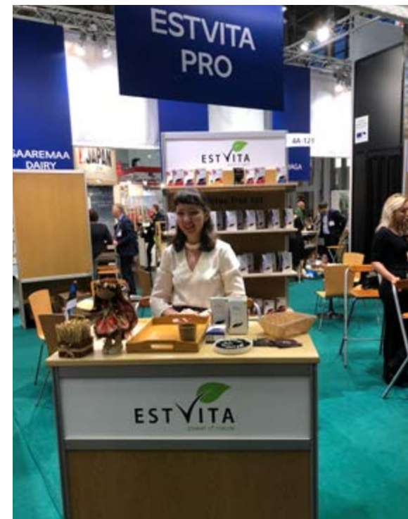
Estvita Pro Biofachi messil

Mess oli kasulik ka tootearenduse aspektist, saadi uusi kontakte teedesse sobivate lisandite ostmiseks ning infot selle kohta, milline toode ja pakend millisele turule sobib.