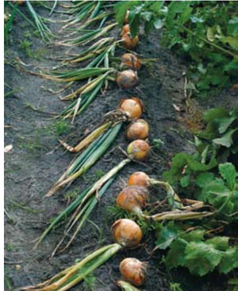
Sibula esmane kuivatamine põllul

NB! Rööv- ja parasitorganismide, bakter-, viirus- ja seenpreparaatide kasutamise võimalusi tuleb kontrollida määruse (EMÜ) nr 2092/91 II lisa B osast.