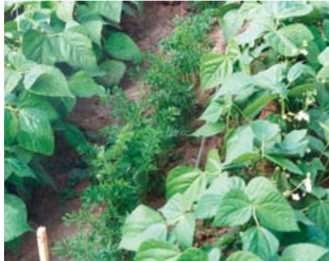
Porgand segus aedoaga

Mullaharimisega mõjutatakse taimekahjustajate elutsükli, seega piiratakse nende arvukust.