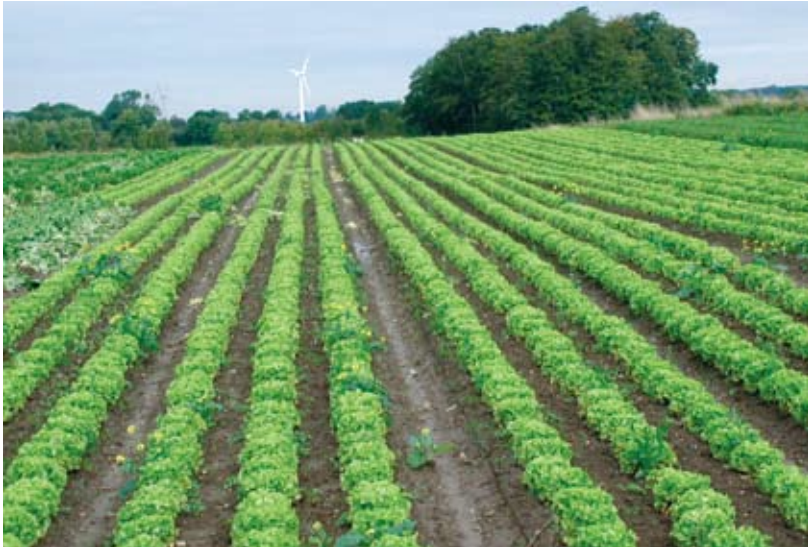
Mahejääsalati põld Taanis

NB! Kasutada tohib ainult neid väetisi ja mullaomaduste parandajaid, mis on mahepõllumajanduses kasutamiseks lubatud ainete nimekirjas määruse (EMÜ) nr 2092/91 II lisa A osas. Neist paljude kasutamine on lubatud ainult TTI nõusolekul. Sellisteks väetisteks on näiteks laudasõnnik, kompostid, verejahu ja muud loomsed kõrvalsaadused, merevetikad ja merevetikatooted, looduslik kaltsiumkarbonaat, looduslik väävel ning mikroelemendid.