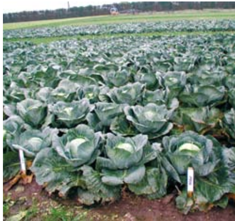
Mahepeakapsa põld Taanis

Kõik istikud ja ka tippisibul peavad pärinema mahepõllumajandusest. Et ka maheistikute hankimisega võib tekkida raskusi, tuleb enamasti istikud ise ette kasvatada.