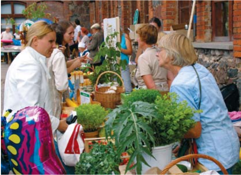
Maheköögivilja müük Põllumajandusmuuseumi sügislaadal Ülenurmel

ähvardava otsese ohu korral. Paljude nimekirjas esitatud taimekaitsevahendite kasutamine on lubatud ainult TTI nõusolekul.